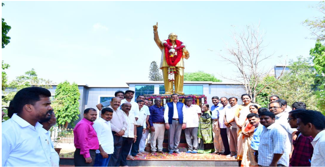
Dr. B.R Ambedkar Research and Extension Centre, University of Mysore. Organized a program on the occasion 133 rd birth anniversary of Dr. B. R. Ambedkar at Vishwajnani Hall, Dr. B.R Ambedkar Research and Extension Centre, University of Mysore, Manasagangothri, UOM, Mysuru in collaboration with SC/ ST special cell, UOM, Mysuru on 14 th April 2024, Sunday.