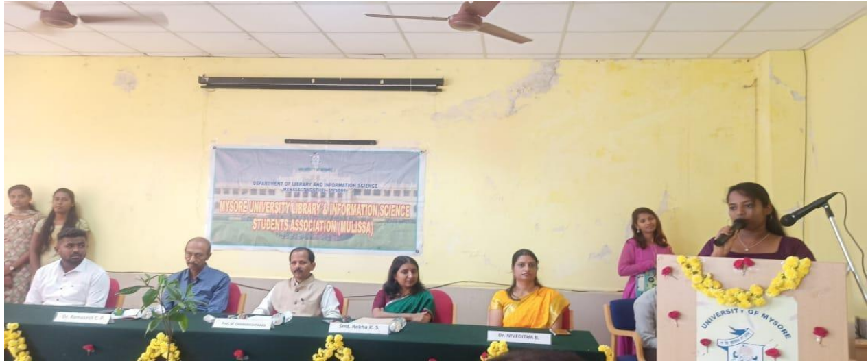
(Student performing a welcome song)