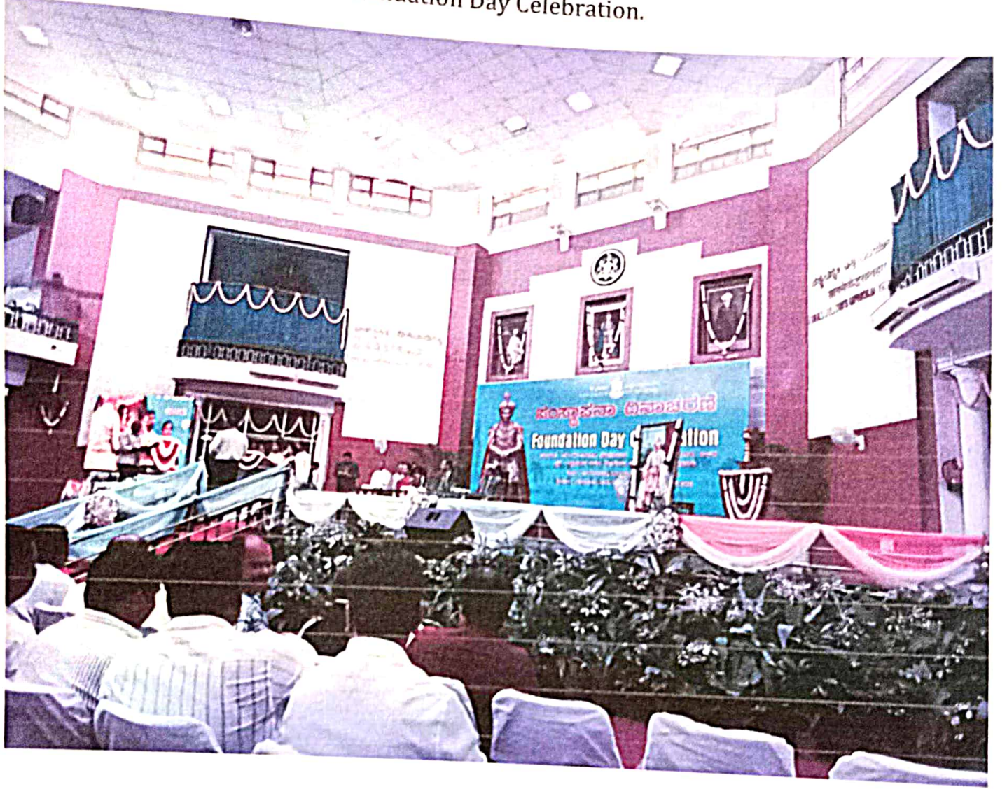
05. Decoration with Ornamental flower pots and green festoon was done on 29-07-2024 at Crawford Hall during the Foundation Day Celebration.