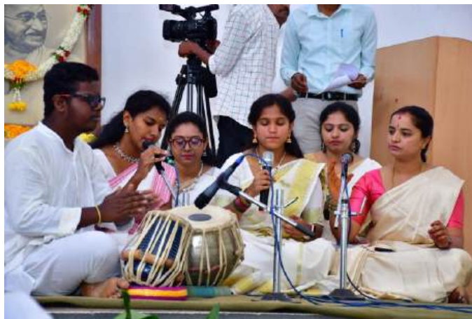
'Gandhi Bhajans' was sung by the students of College of Fine Arts, University of Mysore.

The program started with 'Gandhi Bhajans' by the students of College of Fine Arts, University of Mysore.