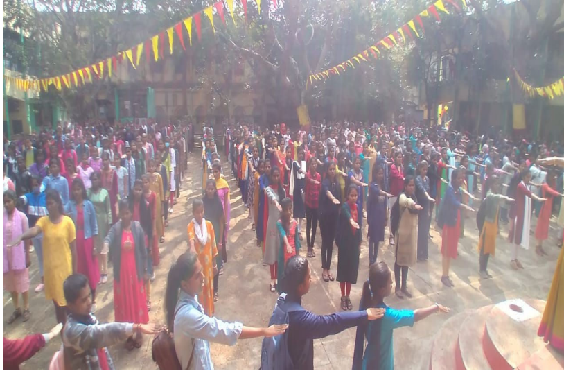
On Dated:31-10-2022 Collaboration with National Service Scheme, University of Mysore, & NSS Cell, Youth Empowerment and Sports Department, Govt of Karnataka, Bangalore Organized National Unity Day Programme Under the Sardarvallabai Patel Birth Anniversary at UOM, NSS Units Colleges.