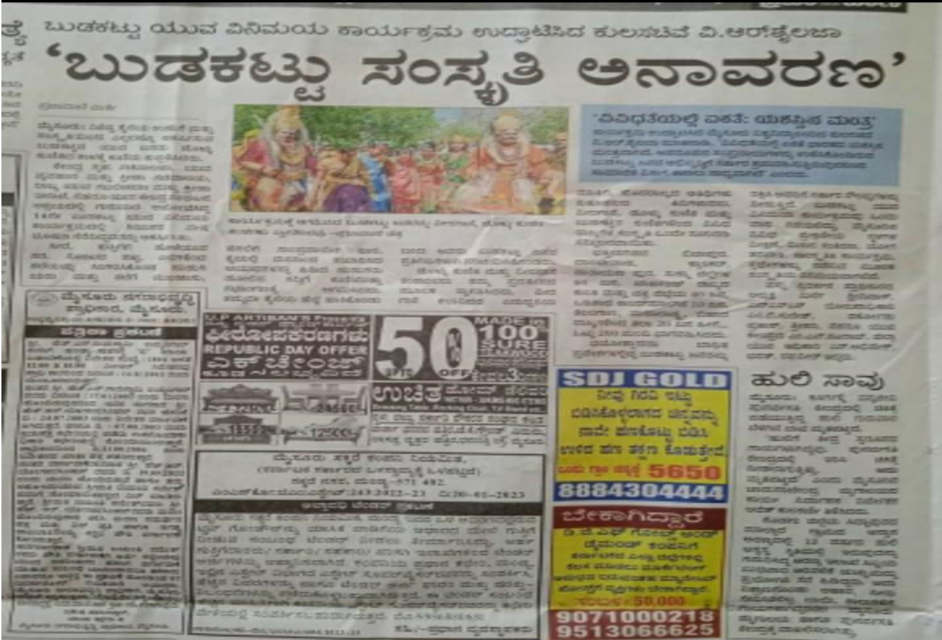
On Dated: 18-01-2023 to 24-01-2023 Collaboration with Nehru Yuva Kendra, Mysuru and National Service Scheme, University of Mysore, Mysuru Organized by 14 th Tribal Youth Exchange Programme at Fine Arts College, University of Mysore, Manasagangothri, Mysuru.