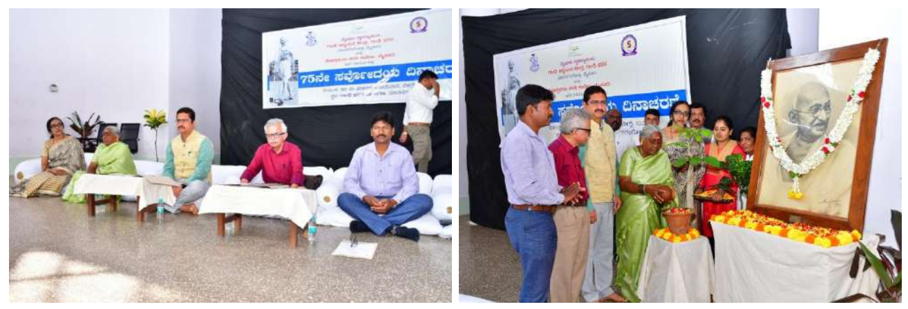
Dignitaries were Inaugurated the Programme by Watering the Plant.

"75th Sarvodaya Day Celebration" was organized in collaboration with University of Mysore, Center for Gandhi Studies, Gandhi Bhavan, Manasagangotri, Mysore and Seshadripuram Sadavi College, Mysore on Date: 30-01-2023 at 10:30 AM on Monday.