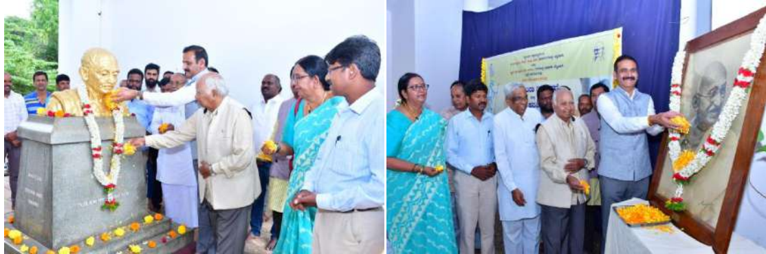
Inaugurated the Programme by Floral Tribute to Mahatma Gandhiji

University of Mysore, Centre for Gandhi Studies, Gandhi Bhavan, Manasagangotri, Mysore and Jnana Deepa First Class College, Gangotri Layout, Mysore organized World Day of Non-Violence and Special Lecture Program on the occasion of 155th Gandhi Jayanti on Date: 02-10-2023. The program started with a prayer performed by the students of College of Fine Arts, University of Mysore.