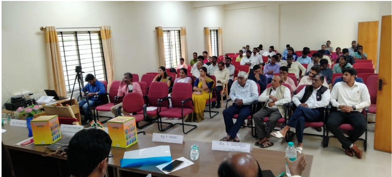
As a Part of 75 th Year Independence day celebration A Special Lecture and Prize distribution ceremony held for the winners of the Essay Writing , Debate and Quiz Competition function with audience