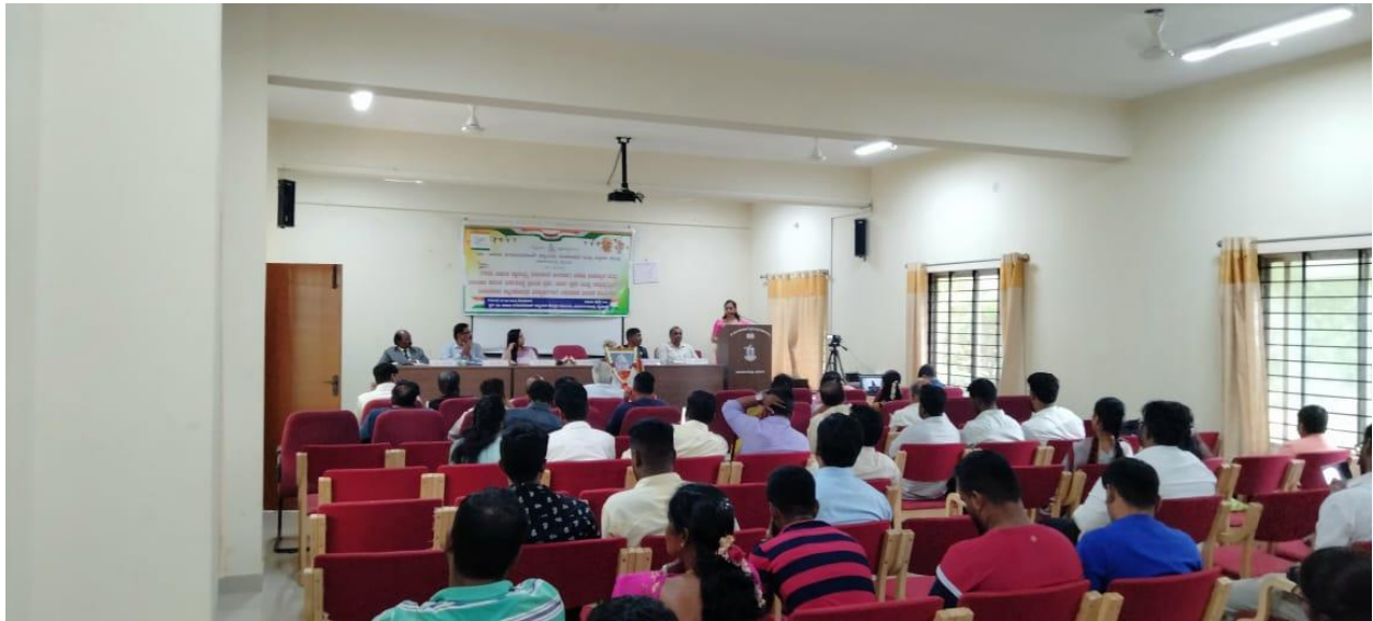
As a Part of 75 th Year Independence day celebration A Special Lecture and Prize distribution ceremony held for the winners of the Essay Writing , Debate and Quiz Competition function with audience