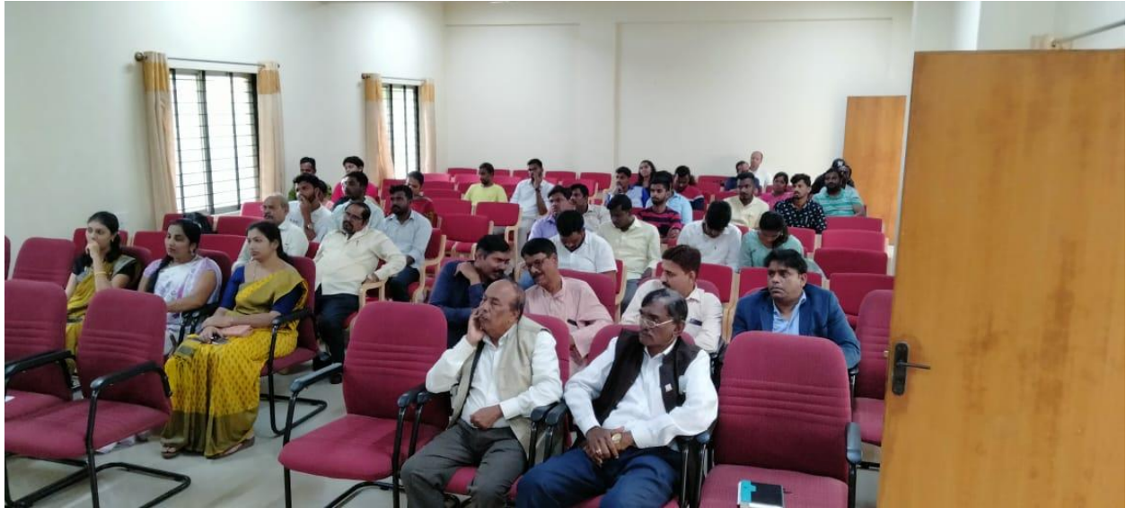
As a Part of 75 th Year Independence day celebration A Special Lecture and Prize distribution ceremony held for the winners of the Essay Writing , Debate and Quiz Competition function with audience