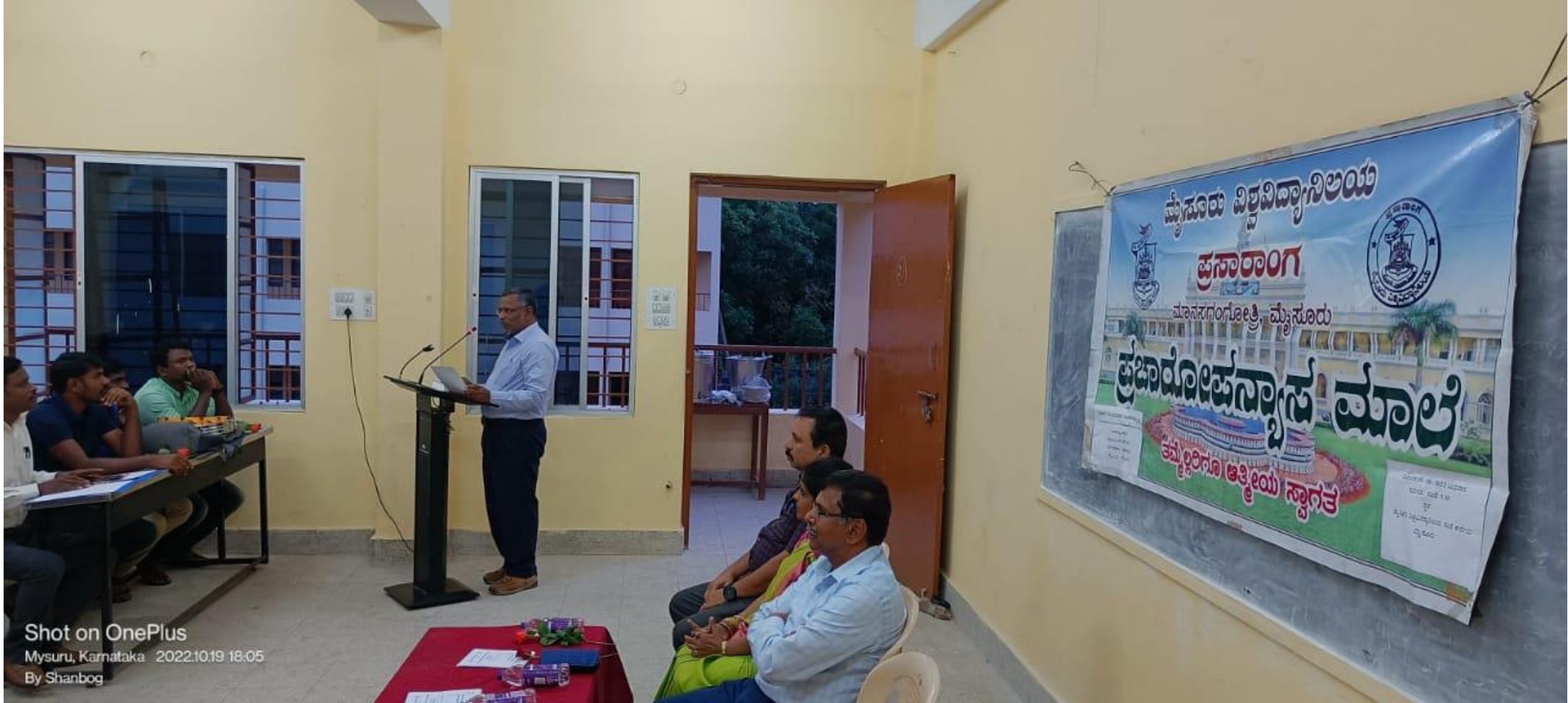
Shot on OnePlus Mysuru, Karnataka 2022.10.19 18:05