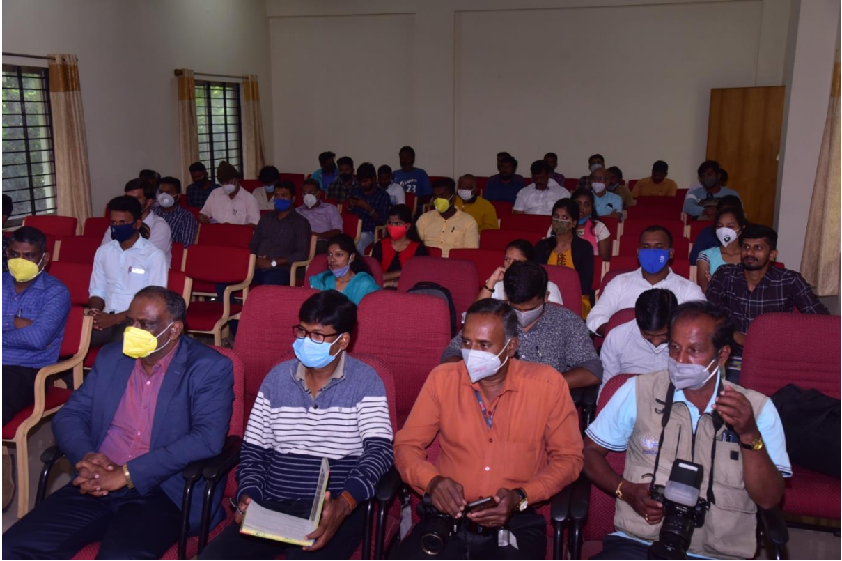
Audience participated in the function organised on 04-09-2021