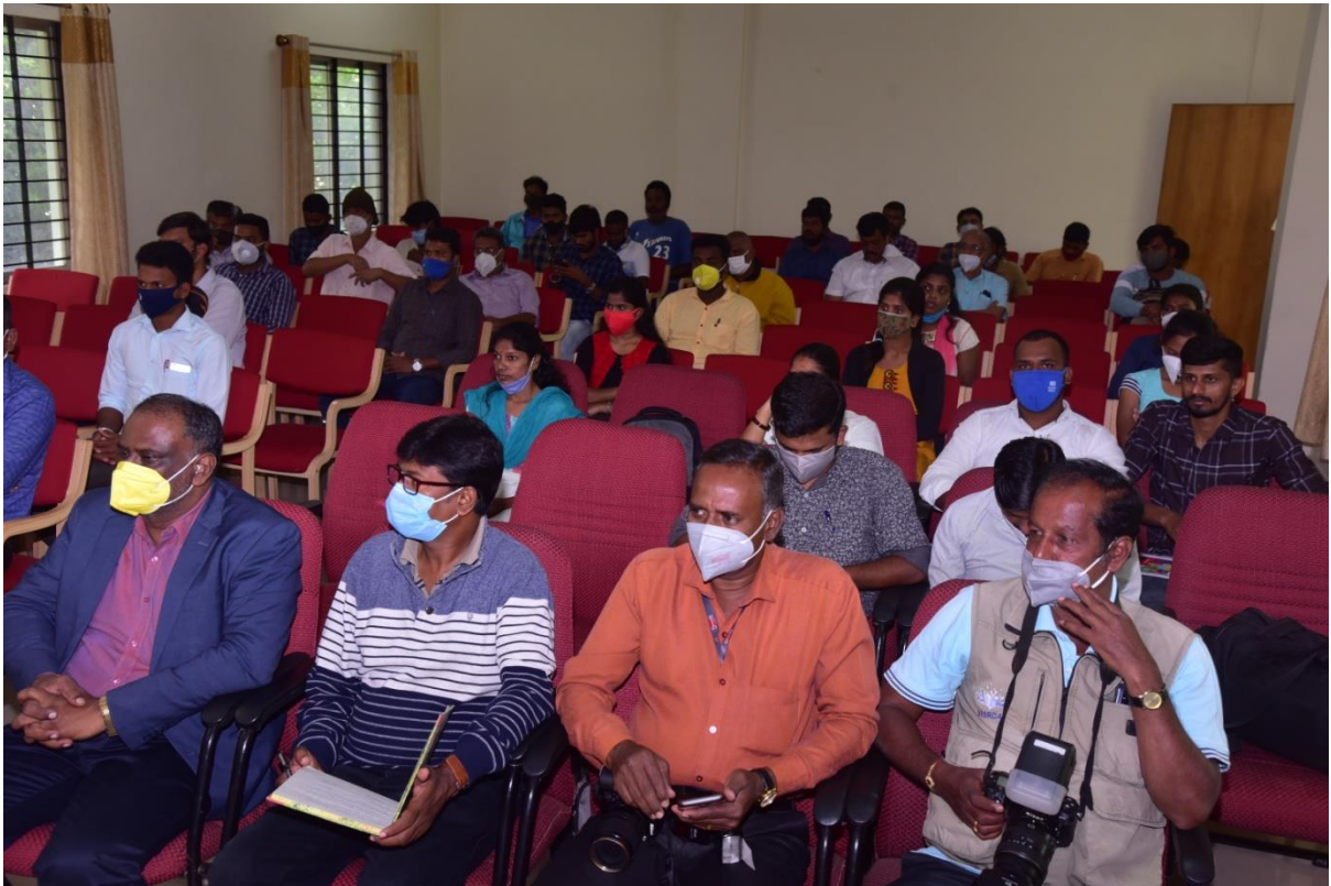
Audience participated in the function organised on 04-09-2021