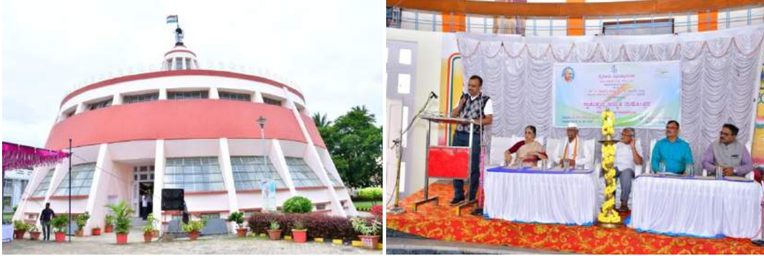
Sathyagraha Sowda, Shivapura, Maddur, Mandya

University of Mysore, Center for Gandhian Studies, Gandhi Bhavan, Manasagangotri, Mysore in association with the Sir. M. Visvesvaraya Postgraduate Centre, Tubinakere, Mandya, National Service Scheme, University of Mysore, Mysore was organized closing ceremony of “AZADI KA AMRUTH MAHOTSAV” on Thursday 25-08-2022 at Sathyagrahasowda, Shivpur, Maddur Taluk, Mandya District.