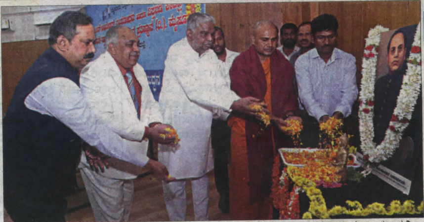
ಮೈಸೂರಿನ ಮಾನಸ ಗಂಗೋತ್ರಿಯ ಡಾ.ಬಿ.ಆರ್.ಅಂಬೇಡ್ಕರ್ ಕೇಂದ್ರದ ವಿಶ್ವಜ್ಞಾನಿ ಸಭಾಂಗಣದಲ್ಲಿ ಸೋಮವಾರ ಹಮ್ಮಿಕೊಂಡಿದ್ದ ಬುದ್ಧ ಪೂರ್ಣಿಮೆಯನ್ನು ಅಂಬೇಡ್ಕರ್ ಭಾವಚಿತ್ರ ಮತ್ತು ಬುದ್ಧನ ಮೂರ್ತಿಗೆ ಪುಷ್ಪ ನಮನ ಸಲ್ಲಿಸುವ ಮೂಲಕ ಸಂಸದ ವಿ.ಶ್ರೀನಿವಾಸ ಪ್ರಸಾದ್ ಉದ್ಘಾಟಿಸಿದರು.

ನಾಲ್ಕಡಿ ಕೃಷ್ಣಾಜಿ ಒಡೆಯರ್ ಅವರ ದೂರದೃಷ್ಟಿಯ ಫಲವಾಗಿ ರಾಜ್ಯದ ಮೊದಲ ವಿವಿಯಾಗಿ ಮೈಸೂರು ವಿವಿ ಸ್ಥಾಪನೆಗೊಂಡಿತು. ಇಲ್ಲಿ ಗಾಂಧಿ, ಬಸವೇಶ್ವರ, ರಾಷ್ಟ್ರಕವಿ ಕುವೆಂಪು ಅವರ ಅಧ್ಯಯನ ಕೇಂದ್ರಗಳಿದ್ದು,