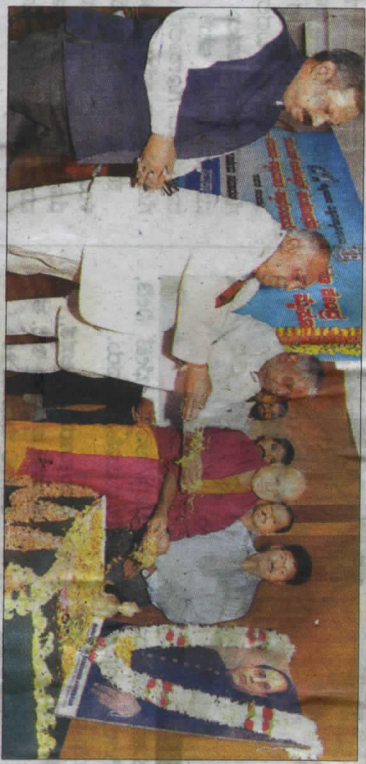
ಬುದ್ಧ ಪೂರ್ಣಿಮೆ ಪ್ರಯುಕ್ತ ಸಮಕಾಲೀನ ಜಗತ್ತಿಗೆ ಬುದ್ಧನ ಚಿಂತನೆಗಳು ಎಂಬ ವಿಷಯದ ವಿಶೇಷ ಉಪನ್ಯಾಸ ಕಾರ್ಯಕ್ರಮದಲ್ಲಿ ಅಂಬೇಡ್ಕರ್ ಭಾವಚಿತ್ರಕ್ಕೆ ಪುಷ್ಪನಮನ ಸಲ್ಲಿಸಲಾಯಿತು.